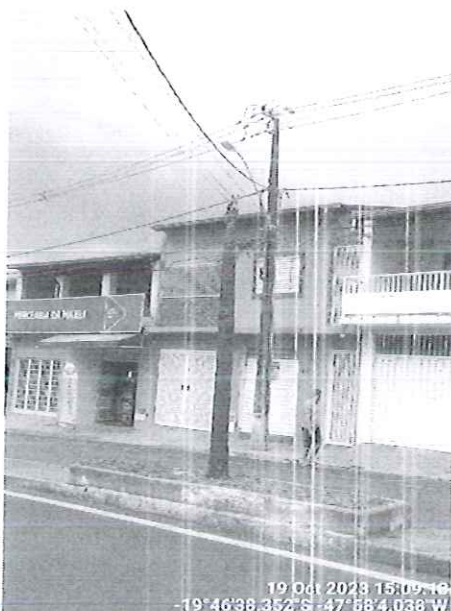
Figura 1 – Vista do estipe a ser desmontado.

Diante disso, encaminhamos a presente solicitação para a Secretaria de Serviços Urbanos e Obras (SESURB) para conhecimento e execução.